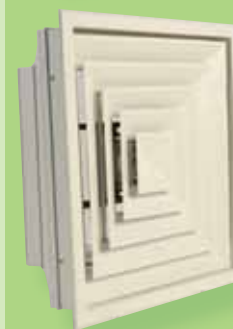
DAV 40 REÁCTIL