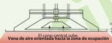
El cono central sube. Vena de aire orientada hacia la zona de ocupación

Para locales INDUSTRIALES de muy alta altura