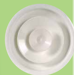
DAV 03 REÁCTIL