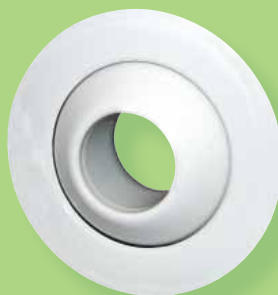
PERLYS PERLYS DESIGN